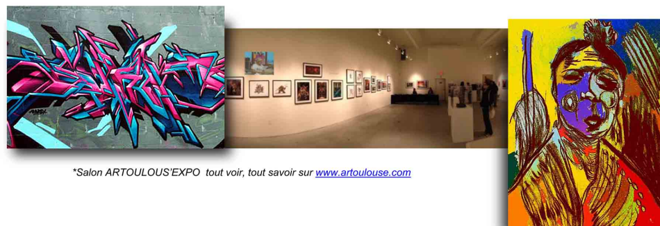
*Salon ARTOULOUS'EXPO tout voir, tout savoir sur www.artoulouse.com